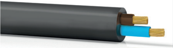
Código: -H05VV - F 2